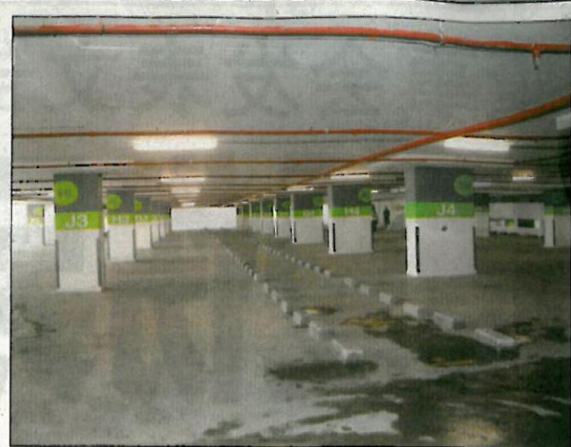
港口商业广场多层停车场。(D)