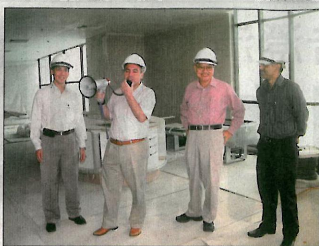
喜来登酒店总经理介绍时摄。(D)