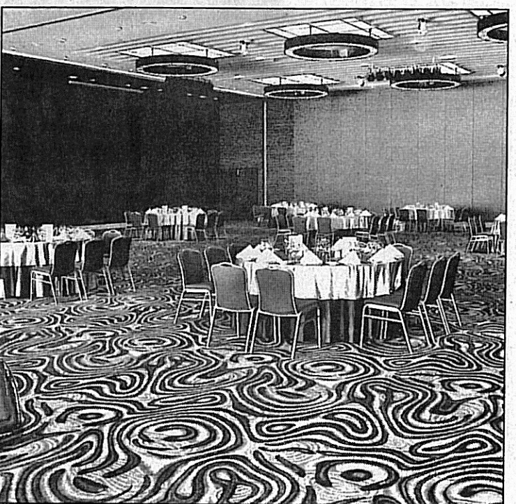
■酒店內的宴客廳可以擺一百席。