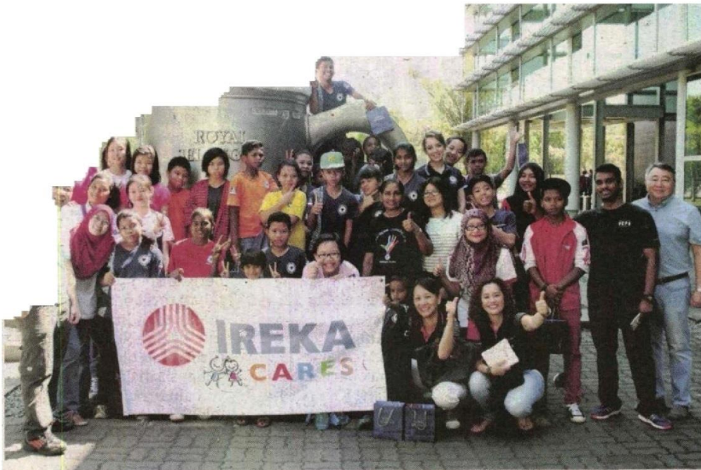
SUKARELAWAN Ireka Cares bergambar bersama kanak-kanak.

Mereka turut dijamu dengan hidangan KFC berhampiran sebaik lawatan tamat, sebelum pulang ke rumah kebajikan dengan perasaan gembira.